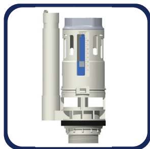
Válvula de descarga