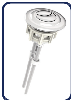
Un Botón independiente Doble acción para instalarse en la tapa superior del tanque